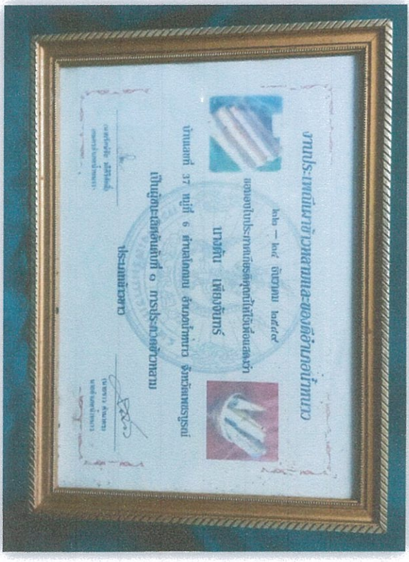
รางวัลชนะเลิศ อันดับ ๑