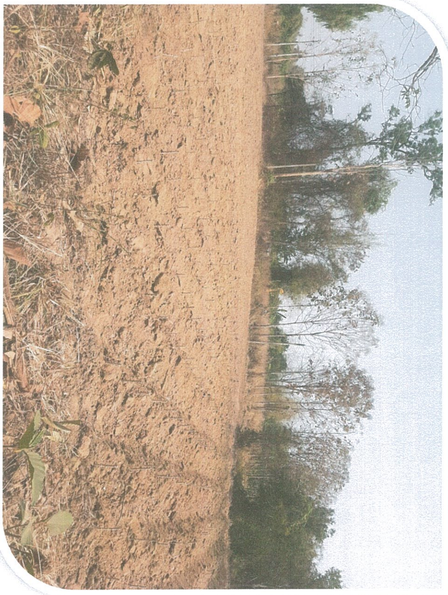
*การปลูกไม้ป่าหลัง

ที่จังหวัดบุรีรัมย์ พื้นที่ปลูกยางพารา-ผลไม้ ครอบคลุมพื้นที่ ๓๐๐ ไร่-๓๕๐ ไร่ ครอบคลุมพื้นที่ ที่เกษตรกรรมปลูกยางพารา-ผลไม้ ๓๐๐ ไร่-๓๕๐ ไร่ ครอบคลุมพื้นที่ ๓๐๐ ไร่-๓๕๐ ไร่ ๓๐๐ ไร่-๓๕๐ ไร่ ครอบคลุมพื้นที่ ๓๐๐ ไร่-๓๕๐ ไร่ ครอบคลุมพื้นที่ ๓๐๐ ไร่-๓๕๐ ไร่ ๓๐๐ ไร่-๓๕๐ ไร่ ครอบคลุมพื้นที่ ๓๐๐ ไร่-๓๕๐ ไร่ ครอบคลุมพื้นที่ ๓๐๐ ไร่-๓๕๐ ไร่