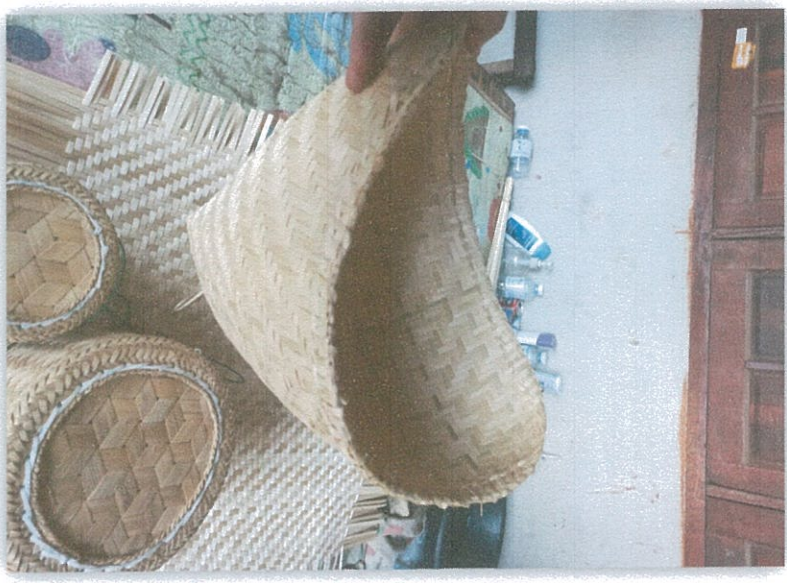
หวดไม้ขี้ขาว