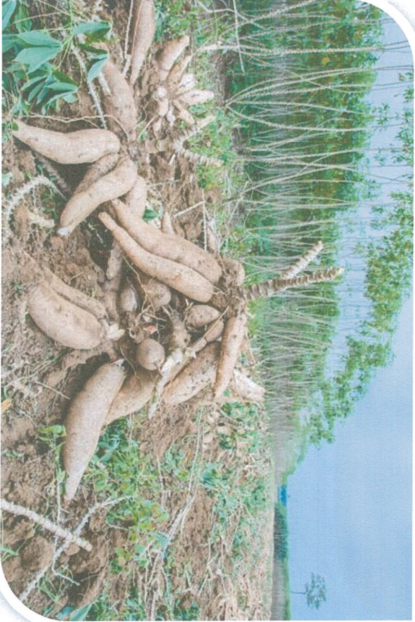
ระยะระยะเปิดหัว