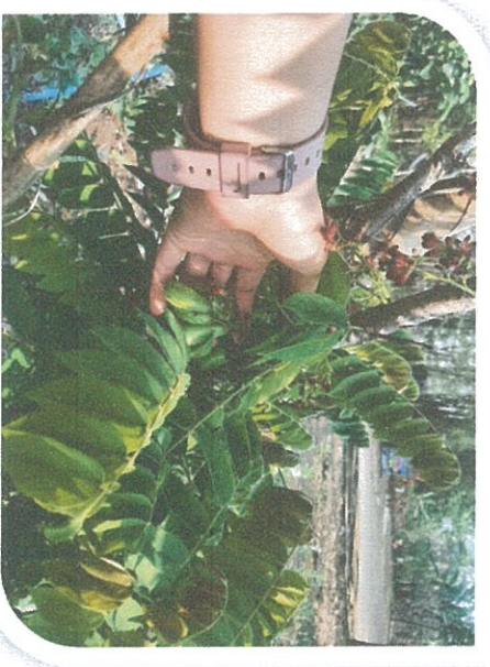
ปลูกต้นตะลิงปลิง