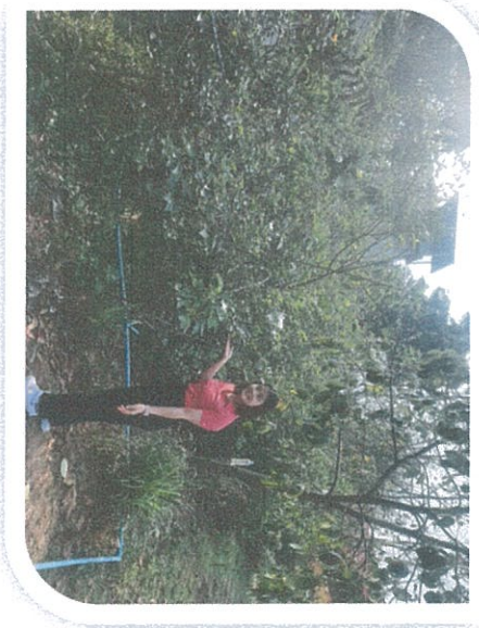
ปลูกผลไม้เบอร์รี่ ต้นมะยม ต้นขนุน