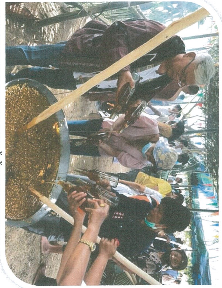
ชาดแม่เต็คอ นาฝั่งตต