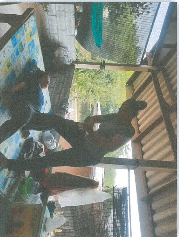
ลูกค้าที่หลุด มือไปนั่งคาบสาย