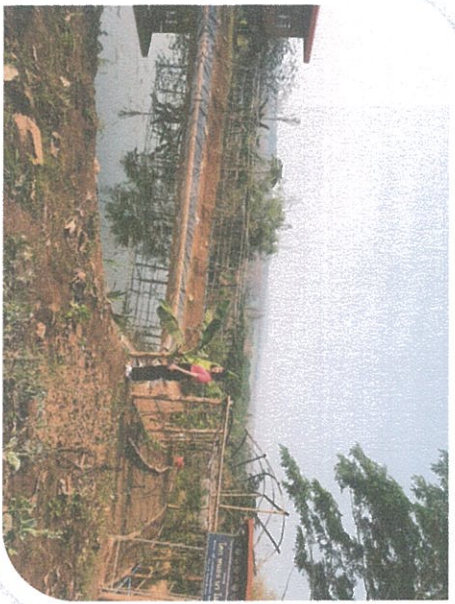
มบ่อเลี้ยงปลา

ซึ่งเป็นรูปแบบหนึ่งของ การแก้ไขปัญหาเรื่องการจัดการน้ำ ที่สถาปนาเศรษฐกิจพอเพียงและมูลนิธิกรรรมธรรมชาติ ได้น้อมนำพระ ราชาดำรัสในพระบาทสมเด็จพระปรมินทรมหาภูมิพล อดุลยเดช รัชกาลที่ ๘ ด้านการทำเกษตรทฤษฎีใหม่ตาม แนวเศรษฐกิจพอเพียงมาใช้ บริหารจัดการน้ำ และพื้นที่ การเกษตร โดยมีการผสมผสานกับภูมิปัญญาพื้นบ้าน ให้สอดคล้องกัน โดยแบ่งพื้นที่เป็นสัดส่วน ๓๐ : ๓๐ : ๓๐ ดังนี้ ๓๐% สำหรับแหล่งน้ำ โดยการขุดบ่อ ทำหนองและคลองไส้ไก่ ๓๐% สำหรับทำนา ปศุสัตว์ ๓๐% สำหรับทำโคกหรือป่า ปศุสัตว์ ๓ อย่าง ประโยชน์ ๔ อย่าง ก็คือปลูกไม้ใช้สอย ไม้กินได้และไม้เศรษฐกิจ เพื่อให้ได้ประโยชน์ คือ มีกิน มีอยู่ มีใช้ มีความสมบูรณ์ และความร่มเย็น และ ๑๐% สำหรับที่อยู่อาศัย