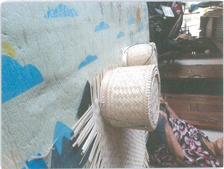
กระติบข้าว