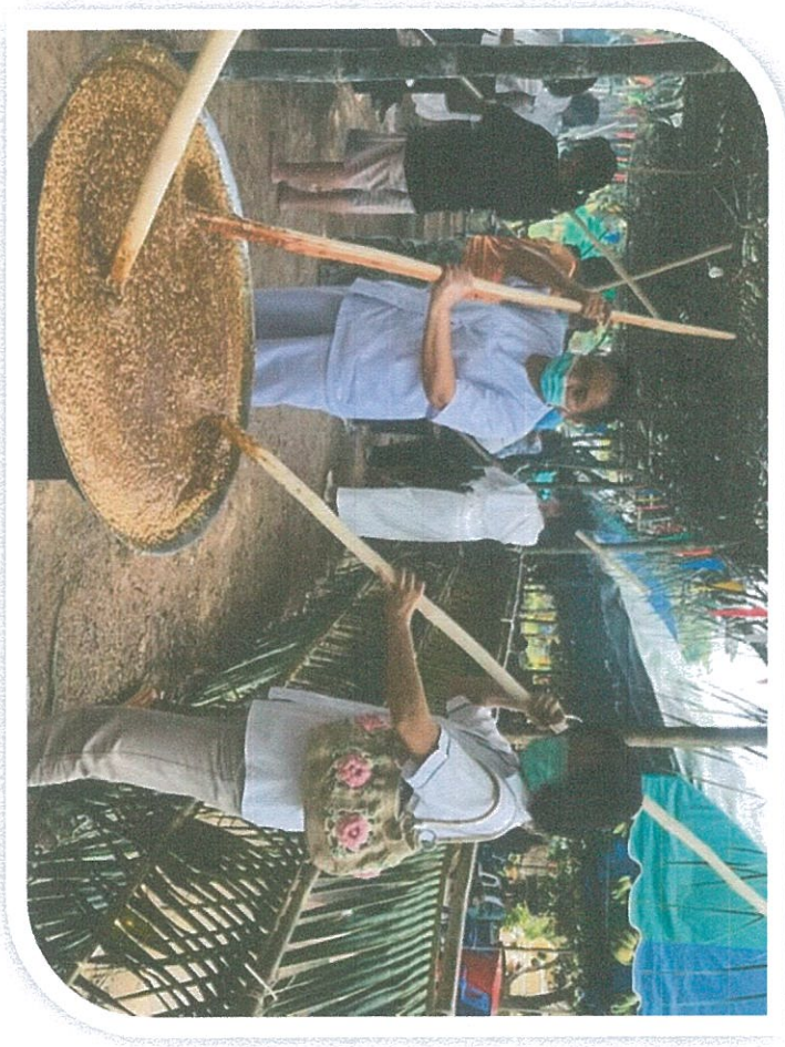
ชาวบ้านช่วยกันกวนข้าวทิพย์

ในปีจุลศัณณิยมทำเสด็จภายในวันเดียว คือ วันขึ้น ๑๔ ค่ำ เดือน ๖ ตอนเช้า จะมีการเจริญพระพุทธมนต์ และพิธีกรรมต่าง ๆ ทั้งพิธีพราหมณ์และพุทธ หลังจากนี้จะทำพิธี กวนไปจนเสร็จ ซึ่งอาจเสร็จสิ้นในเวลาภาคค่ำ พอรุ่งเช้าวันขึ้น ๑๕ ค่ำ เดือน ๖ ก็จะทำพิธีถวาย เป็นพุทธบูชา ถวายพระสงฆ์และแจกจ่ายแก่ผู้ร่วมพิธีหรือบุคคลทั่วไป