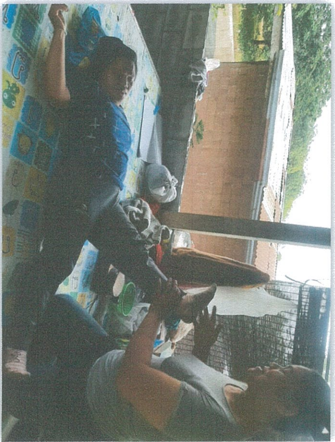
ลูกค้าที่มานวด ล้างจองคิ้วล้าง หน้าเสมอ