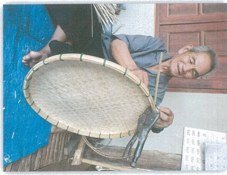
กระตังแบบถี่