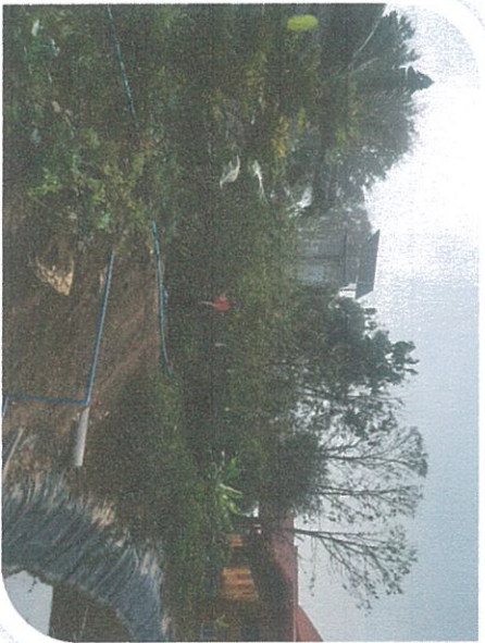
ปลูกผักสวนครัว เช่น คะน้า ผักชีฝรั่ง ผักกวางตุ้ง