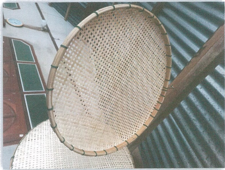
กระตังแบบห่าง