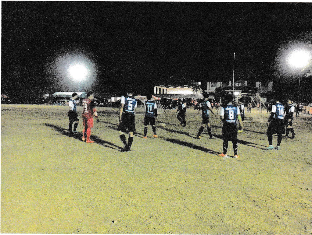
ลานกีฬา หมู่ 6